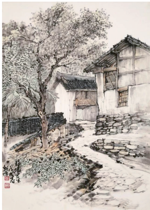
张坝古村 蒙朝晖作品

离开张坝古村,走到河对面时,忍不住又回头看这个正在开发、即将打造成为文化旅游景点的古村,那房舍院落落在树的掩影里,在阳光的普照下,鲜活成一幅让时间抹不去的风景。