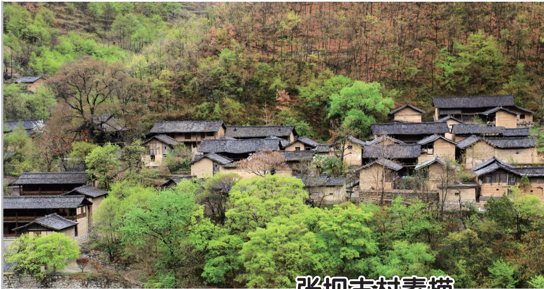
张坝古村