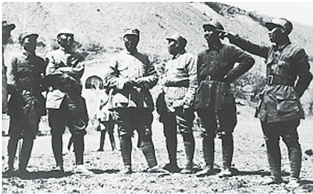
朱德(右三)、贺龙(右四)在政委王震(右二)陪同下视察南泥湾