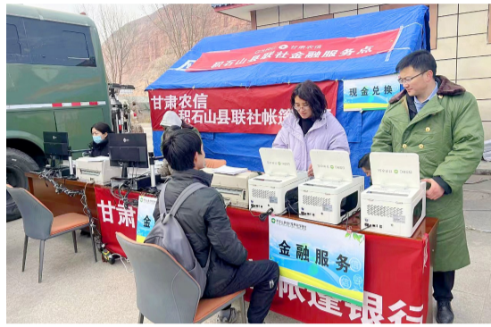
积石山县联社搭建“帐篷银行”做到金融服务不中断。

省地方金融监督管理局、人民银行甘肃省分行、国家金融监督管理总局甘肃监管局负责同志到甘肃农信帐篷银行,关心慰问基层员工,现场查看业务流程,要求甘肃农信认真贯彻落实监管关于加强受灾地区应急金融服务各项要求,发挥自身优势,因地制宜开展特色化、本土化、便捷化金融服务,及时响应、高效保障受灾群众的金融需求。