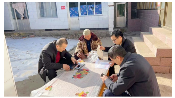
积石山县联社客户经理上门为受灾群众发放“灾后振兴贷”。

一方有难,八方支援。省农信联社积极践行社会责任,从受灾群众最现实、最紧迫的需要出发,心系群众冷暖,关心群众生活,通过甘肃省慈善总会向积石山灾区捐款100万元,分两批捐赠价值36万元的紧缺物资,全省农信系统员工捐款298万元。“鱼水情深一条心、众志成城战灾情”的倡议发出后,甘肃农信人积极响应,短短24小时完成捐款,以凡人微光汇聚了“万众一心战灾情”的强大力量。向积石山联社下拨专项资金,用于购置棉被等救灾物资和受损房屋修缮。组建党员先锋队,备足食物、饮用水、药品等物资,深入受灾严重的乡村帮助灾区群众解决实际困难,以有温度、广覆盖、重地气的金融服务和志愿活动,为积石山抗震救灾贡献农信力量。12月20日,省农信联社向地震震源中心的柳沟乡捐赠煤炭20吨,帮助灾区群众温暖过冬。12月24日,又向地震灾区送去棉被1000条、棉衣300套、取暖烤箱220套、棉帐篷5顶等抗震救灾物资。