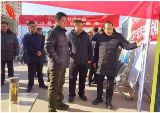
省常委、副省长张锦刚,深入灾区指导甘肃农信“帐篷银行”开展金融服务工作。

在保障受灾群众支付结算等金融服务的基础上,省农信联社主要负责人对灾后重建、复工复产等受灾群众最关注的问题高度重视,多次前往灾区一线调研指导,实地了解金融服务和受灾户生产生活情况及信贷需求。按照“特事特办”的原则,根据灾区融资需求实际,省农信联社迅速搭建“帐篷银行”,第一时间推出“灾后振兴贷”专属产品,助力当地受灾群众恢复灾后生产生活。