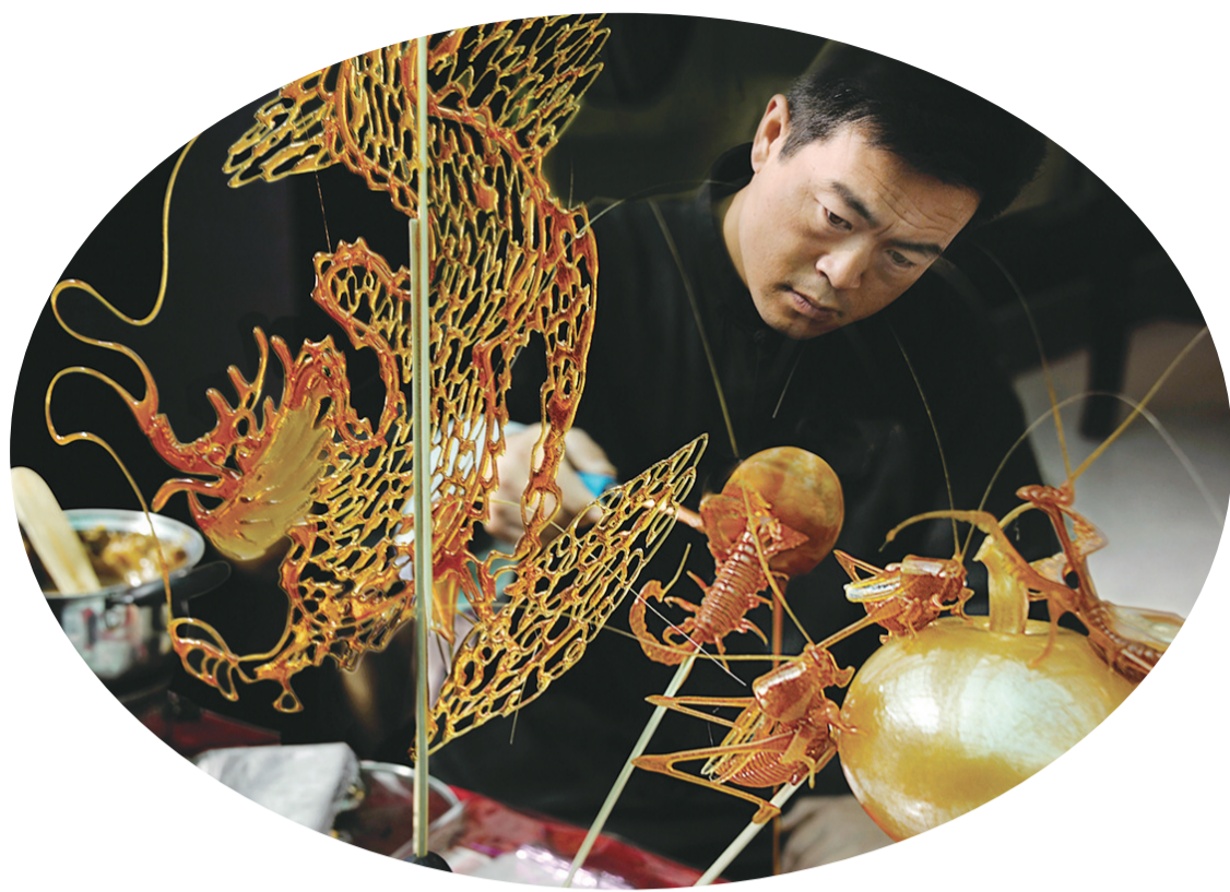
第九届中国民间艺术节上的糖画艺人

就提出了能量守恒。《道德经》第七十七章中有这样的表述:“天之道,其犹张弓欤?高者抑之,下者举之,有余者损之,不足者补之。天之道,损有余而补不足。”所以有钱的人不要奢侈,有权的人不要作威。一阴一阳是靠大自然本身来调节的,使“阴阳”永远处于平衡之中。《阴符经》中说:“天地,万物之盗;万物,人之盗;人,万物之盗。三盗既宜,三才既安。故曰:食其时,百骸理;动其机,万化安。”天地是万物存在的基础,万物是人存在的基础,人又是万物存在的前提条件,它们相互连接。