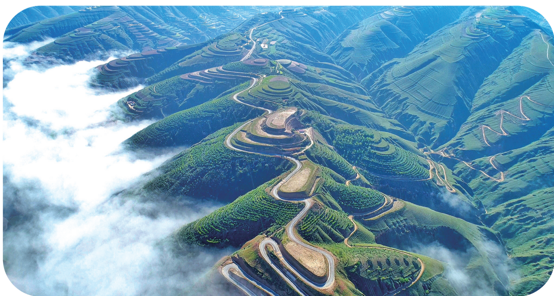
通村公路

第一个要点就是“阴阳”,这两个字构成了中国人自己的能量守恒学说。中国人把一阴一阳的能量守恒看作一个可调节系统。西方人在19世纪中叶发现了自然科学中的能量守恒定律,中国人几千年前