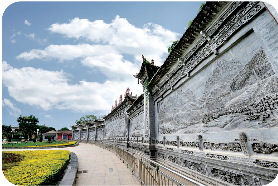
临夏砖雕

我在“仁义礼智信”的基础上,提出了这样一个文化概念——刚强勇毅新。“刚”就是中国人不动如山的战斗意志,一个民族最不能缺少的就是这种阳刚的战斗意志。“强”就是昂扬向上的精神状态,中国人绝不能活得萎靡颓丧。“勇”是胆识气魄,万丈雄心,谁都不能阻拦。孔子在《论语·子罕》有这样的论述:“知者不惑,仁者不忧,勇者不惧。”君子品格有三条:仁、智、勇。一个人只有好心肠和聪明的头脑是不够的,必须有胆量、有气魄。“毅”,《说文解字》讲:“毅,有决也。”注曰:“果决也。”就是不达目的决不罢休的意思。中国人要把这种品格建立起来,在奋斗的路上不达目的决不罢休。《道德经》第六十四章说:“民之从事,常于几成而败之。”他说老百姓做事经常有头无尾,做到快成功的时候就不做了。老子开的药方是:“慎终如始,则无败事。”做事必须有始有终。“新”,创新成为今天的时代强音,改革开放给我们提出了这个问题。什么是创新?《易经·系辞》说:“变通者,趋时者也。”就是与时俱进的意思。创新有什么要求?《大学》里讲:“苟日新,日日新,又日新。”就是毛主席说的“好好学习,天天向上”。我们用什么样的精神来实现创新?《大学》里讲:“君子无所不用其极。”就是把所有的心力、体力都拿出来。“刚强