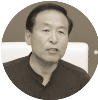
王世明 WANG SHIMING

1955年生,北京怀柔人,中共党员,北京大学法学硕士、清华大学哲学博士。曾任第十三届全国政协文化文史和学习委员会副主任,中宣部副部长。