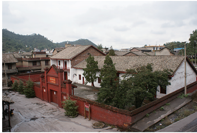
中共安源地委党校旧址

这所缘起于清乾隆十四年(1749年)始建的南安书院发展而来的百年老校,随着时代的进步,为适应中国特色社会主义社会的建设和当地经济发展的需求,2009年7月更名为“定西工贸中等专业学校”,后又于2021年更名为“定西中医药科技中等专业学校”,开启了面向现代化职业教育的新征程。