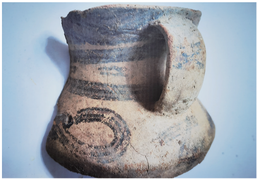
和政县高庙出土的齐家文化彩陶

甘肃是华夏文明的重要发祥地,大夏人生活在大夏河(今大通河)流域的甘肃广河、和政一带。作为当时全国文化政治中心的大夏地区,将彩陶艺术推向顶峰,创造了开辟人类新纪元的马家窑文化。大夏人的子孙大禹深受故乡彩陶文明、齐家文化的熏陶,治理洪水,统治诸夷,开创夏代文明的先河(为了纪念大禹的历史功业,今临夏地区的积石山、和政、广河等县在过去修建了大量禹王庙,有的村庄也以禹王命名)。大夏河地区的玉石之路文明、彩陶文明和夏文明相互印证,说明大夏河地区曾经是齐家文化的摇篮和夏文明的中心区域。