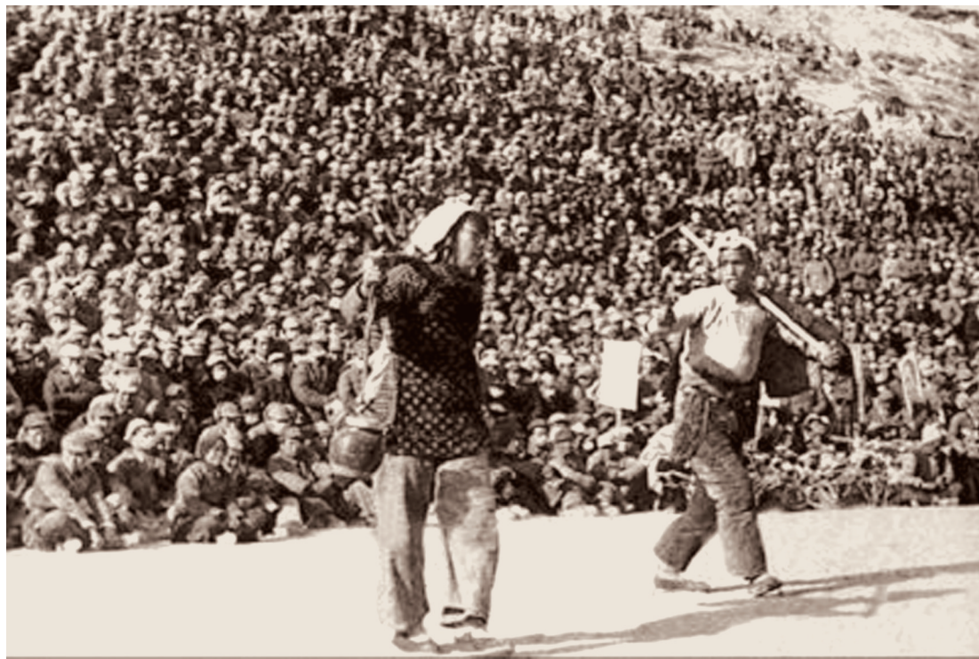
秧歌剧《兄妹开荒》

陇东,是陕甘宁边区的重要组成部分,也是红色文化的摇篮。这片土地上进行的波澜壮阔的革命斗争,不仅为新中国的建立作出了卓越贡献,也使红色文化源远流长、发扬光大。