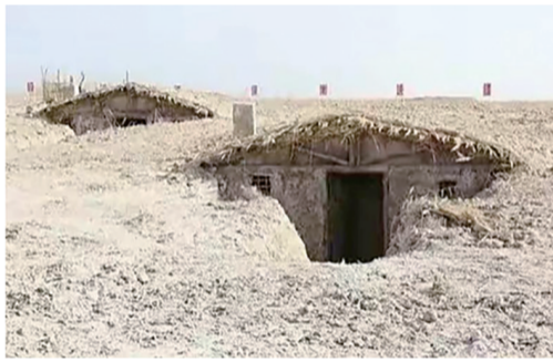
战士们曾经住过的地窝子。

作为一名有着60多年党龄的老党员,我始终认为党和人民的利益永远高于一切。我荣获中共中央、国务院、中央军委颁发的庆祝中华人民共和国成立70周年纪念章,内心既骄傲又激动,回顾往事我问心无愧,特别是无愧于戍边垦疆的那个伟大时代。(下·全文完)