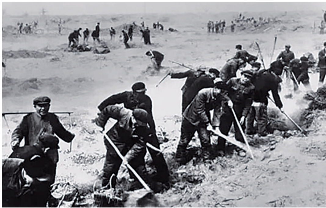
进疆战士开展大开发、大生产。

1958年1月,我光荣加入中国共产党。当时兵团粮食供应不上,我们就减少口粮,没有蔬菜就用盐水泡辣椒下面。没地方住就在地面上挖个坑找些芦苇草和柳柳搭个顶,名曰“干打垒”或叫“地窝子”。没有水源,就挖个坑存雨水。有木工特长的就去制犁开地,有铁匠特长的就去打铁造锅,大家都抢着干争着做,热情高涨。虽然自然环境极其恶劣,生产工具相当落后,生活条件异常艰苦,但我们心里却并不觉得苦,坚信一切都会好起来的。垦荒时吃的是窝窝头,自我感觉身体比较壮实,就常常省下自己的一部分窝窝头分给其他战友吃,希望战友们能够保证足够的体力,我们一起齐心协力多垦荒、垦好荒。