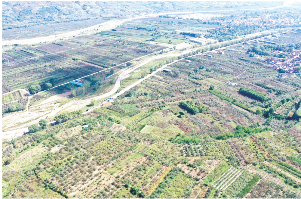
图为出土两座秦早期贵族墓、经抢救性发掘后已回填的礼县圆顶山遗址。

是怎样的一方水土留住了如此彪悍坚韧的秦人先祖们跋涉的步履?当时的礼县,又是怎样的一番生机盎然?